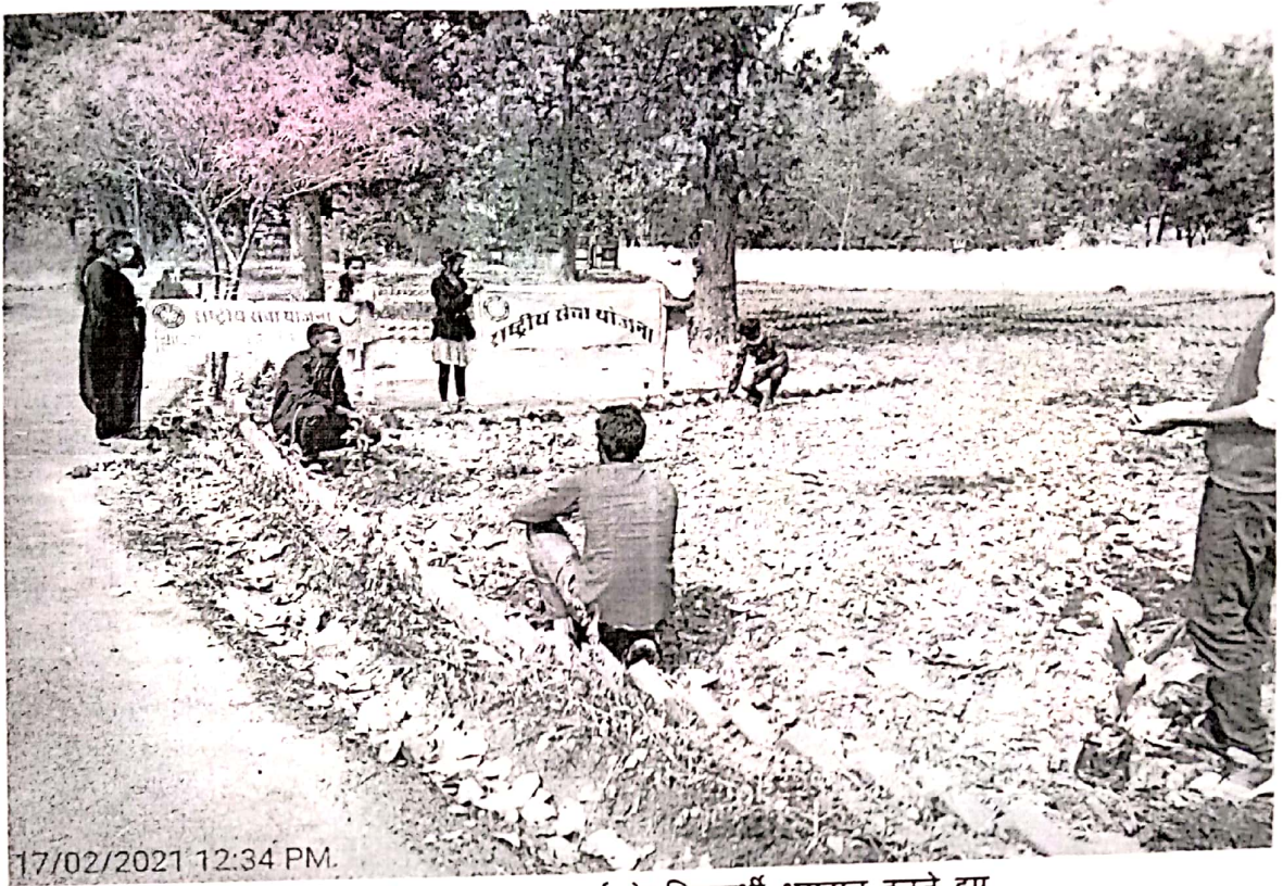
महाविद्यालय के एनएसएस इकाई के विद्यार्थी श्रमदान करते हुए